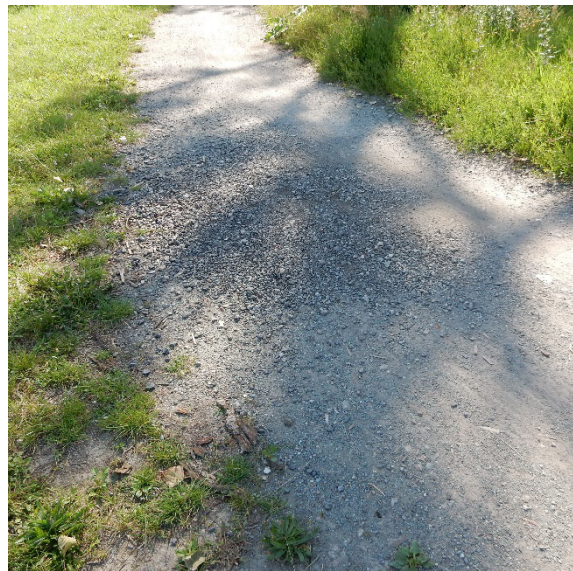
Bild zeigt loses Material im südlichen Bereich.