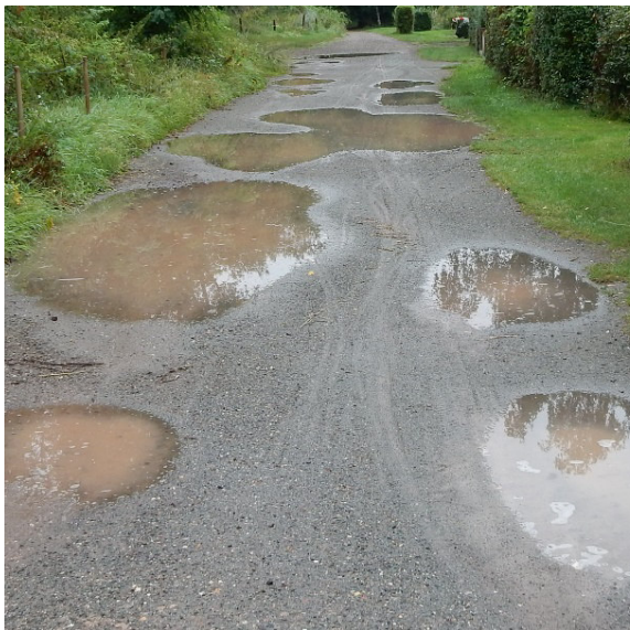
Der nördliche Weg bei Regen ist eine Pfützenlandschaft.